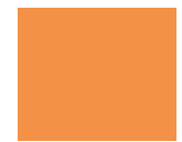
Mandarin Orange ES22