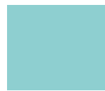
Mint Blue ES5