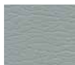
Dove Grey 291-5666