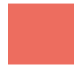
Scarlet Red ES24