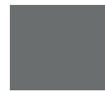
Ash Grey ES32