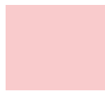
Coral Pink ES20