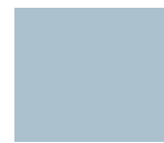
Light Grey ES33