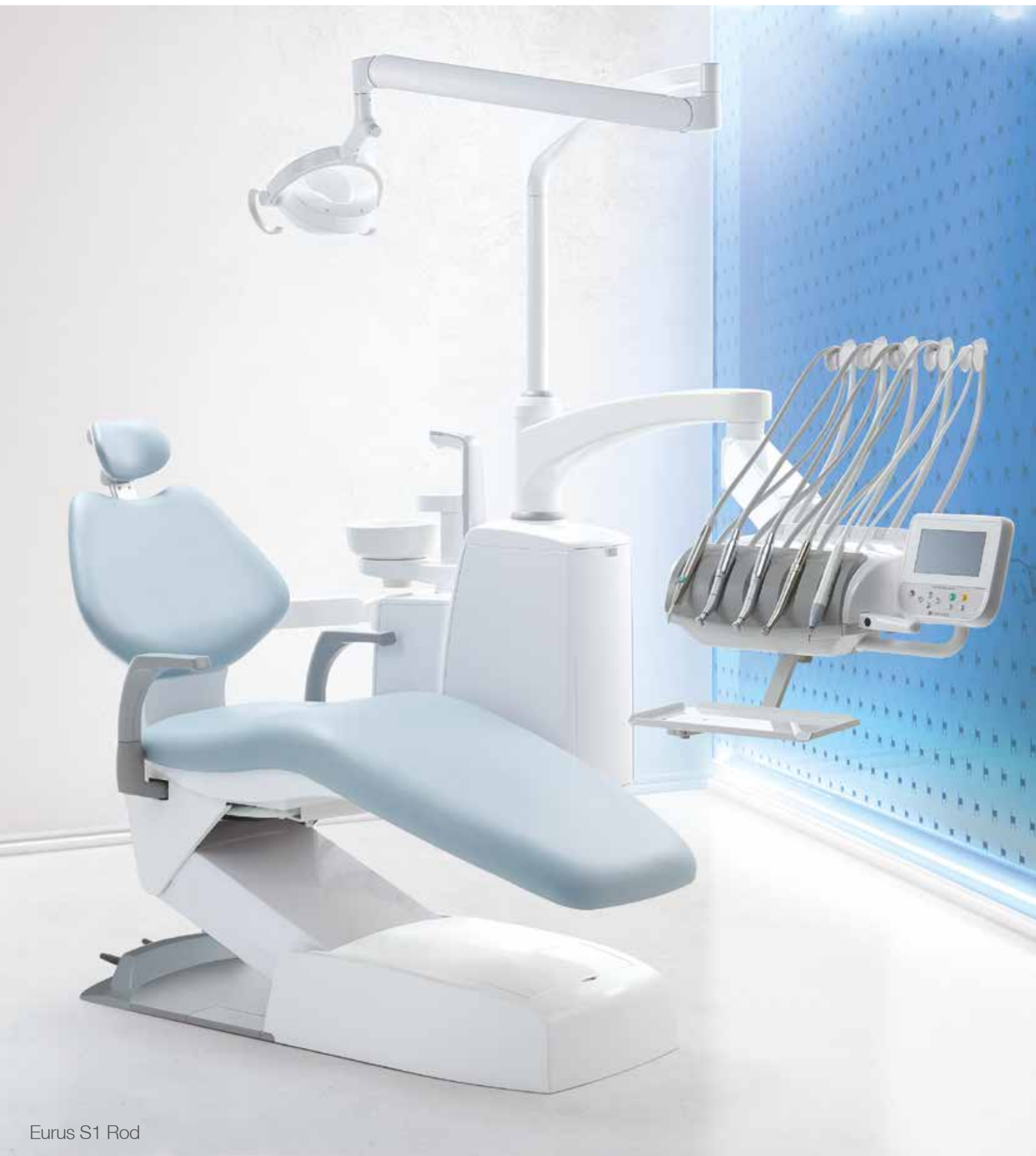
Eurus S1 Rod