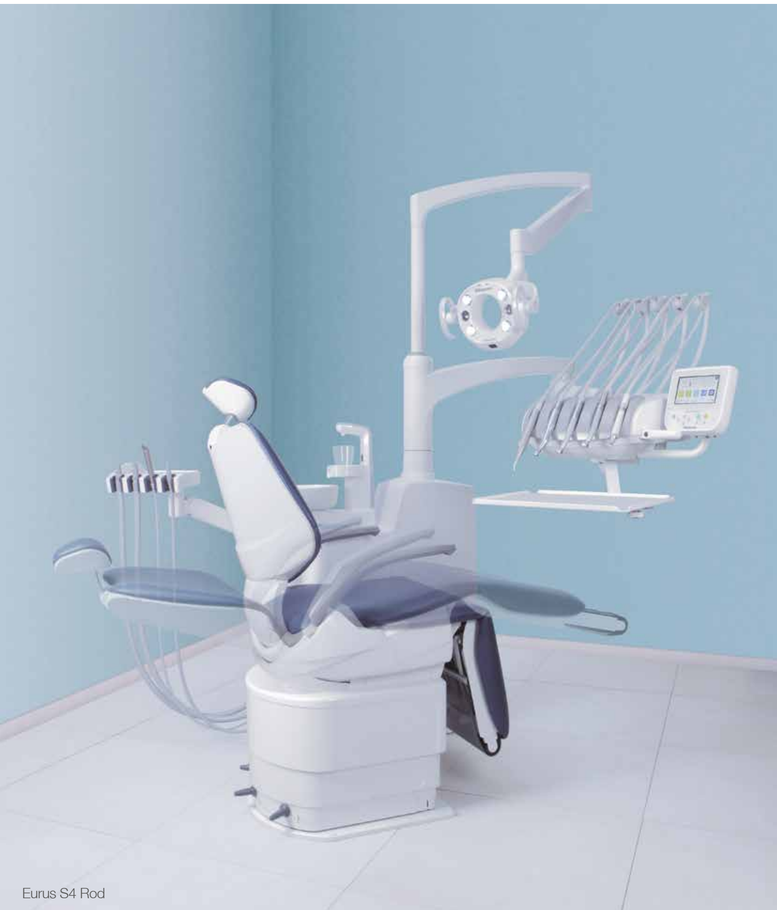
Eurus S4 Rod