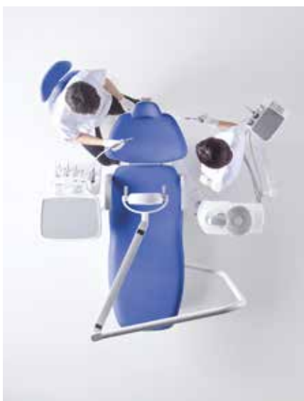
Posizione a quattro mani

Nell'operatività a quattro mani, il vassoio della tavoletta medico fornisce al dentista e all'assistente un piano comune, facilitando tutte le operazioni del workflow odontoiatrico.