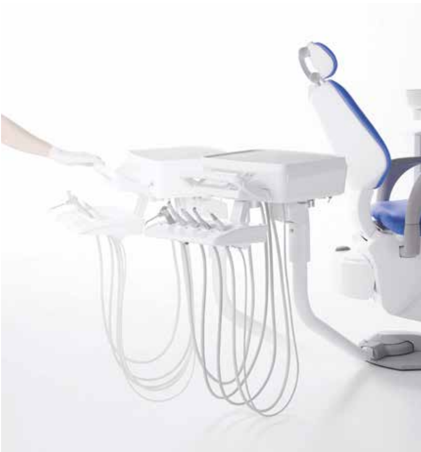
Eurus S8 base mount