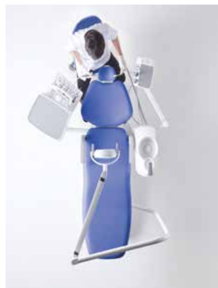
Posizione a due mani

Nell'operatività a quattro mani, il vassoio della tavoletta medico fornisce al dentista e all'assistente un piano comune, facilitando tutte le operazioni del workflow odontoiatrico.