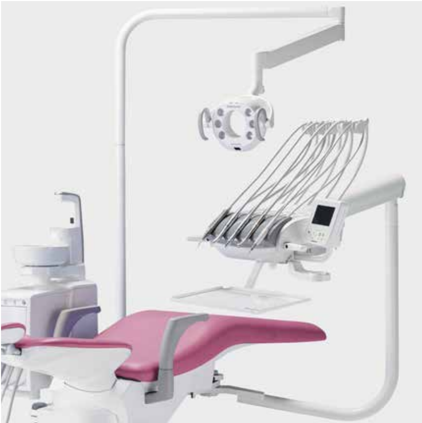
Eurus S8 Rod