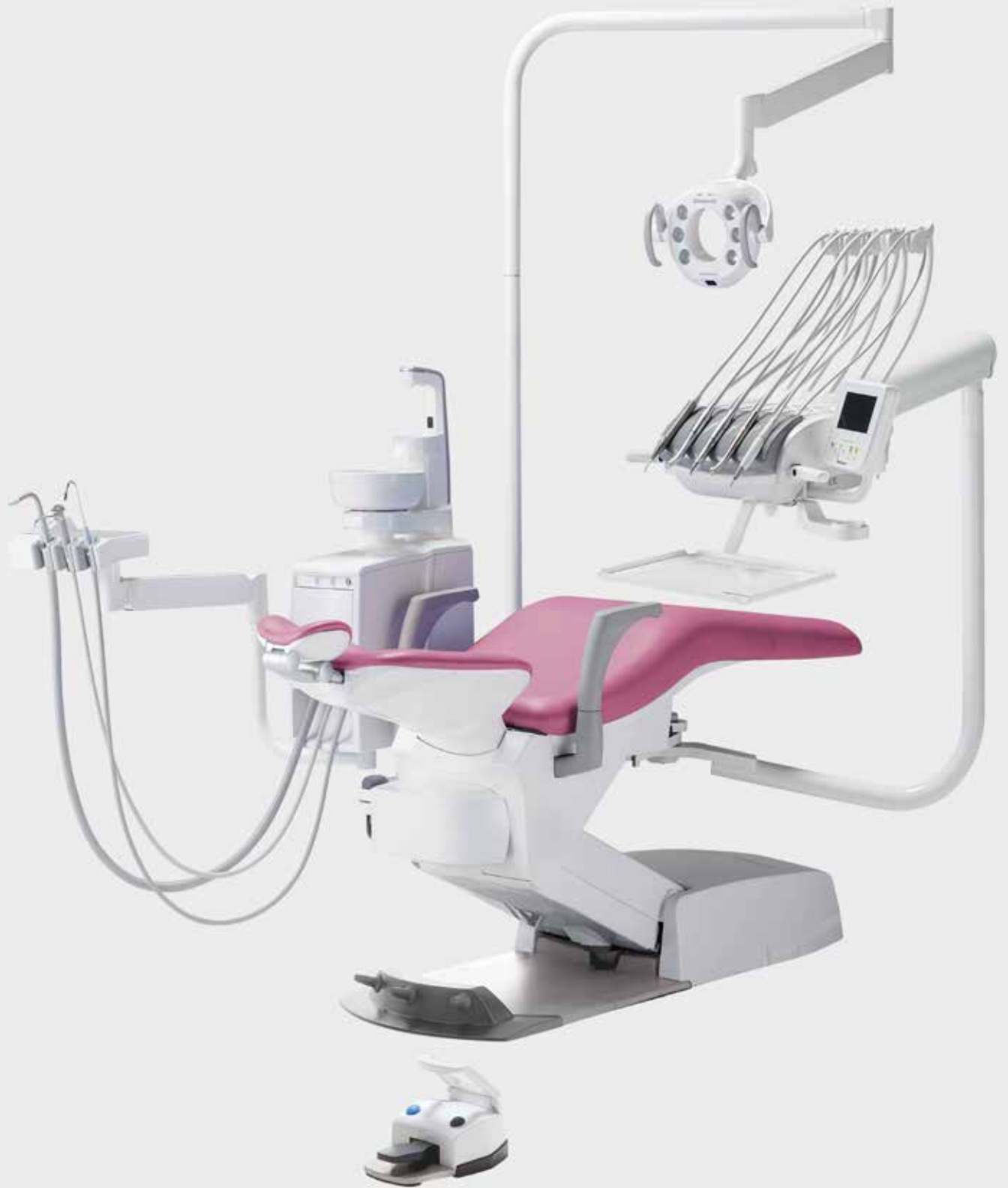
Eurus S8 Rod