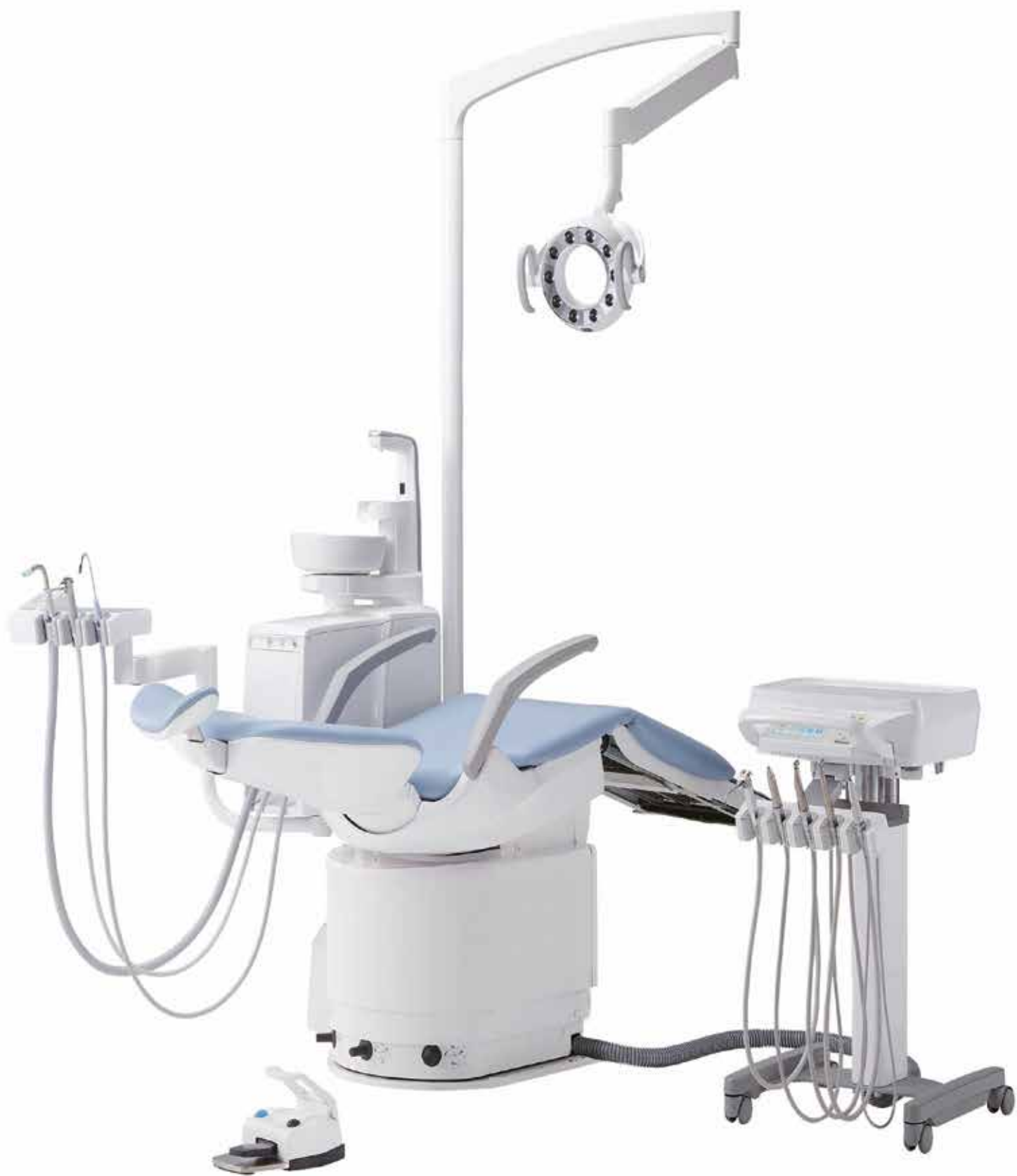
Eurus S6 carrello