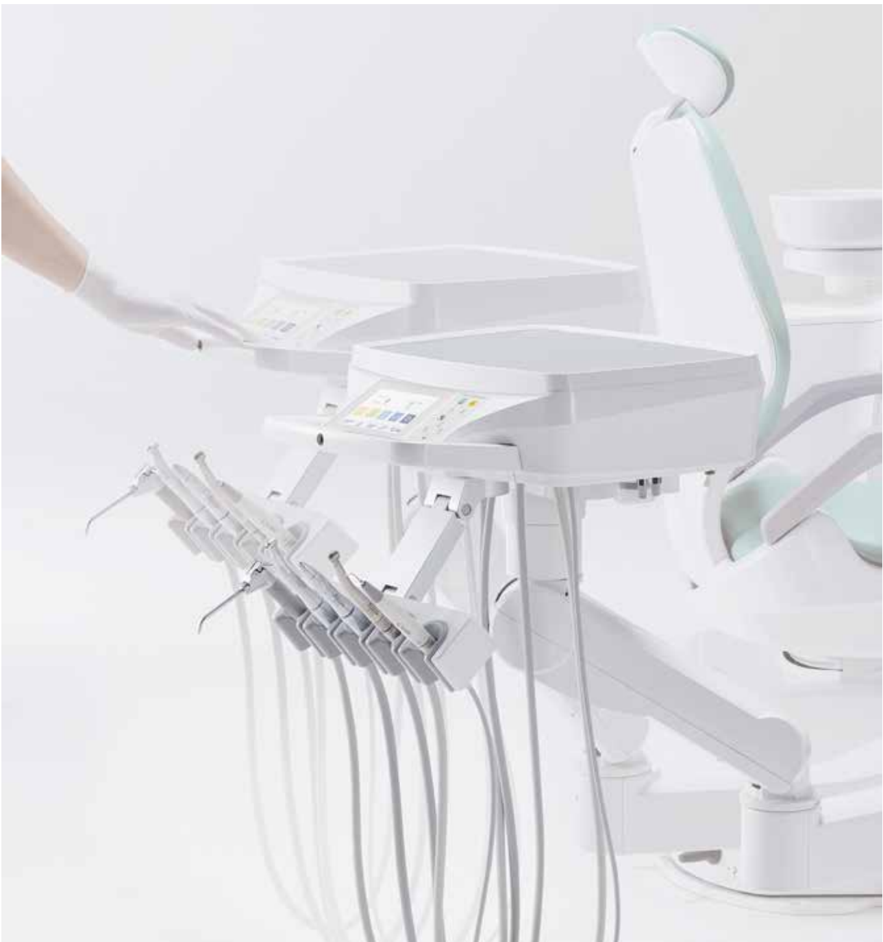
Eurus S6 base mount

Il braccio della tavoletta medico è dotato di un sistema di frenaggio ad aria che ne migliora la flessibilità e la stabilità. La movimentazione della tavoletta dottore risulta così semplice e leggera, permettendo al dottore di posizionarla senza sforzo all'altezza desiderata.