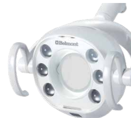
Specchietto paziente per lampada