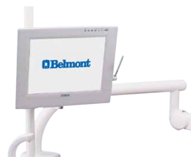
Braccio per monitor odontoiatrico

Il seggiolino Belmont di ultima generazione completa la gamma Clesta ed è disponibile nella versione dottore e assistente. La seduta e lo schienale sono regolabili in altezza e inclinazione. Materiali, forma e specifiche tecniche offrono il massimo sostegno e comfort anche nei trattamenti di lunga durata. Un'estensione in altezza min/max incrementata permette di adattarsi alle caratteristiche fisiche e di stile di ogni utilizzatore.